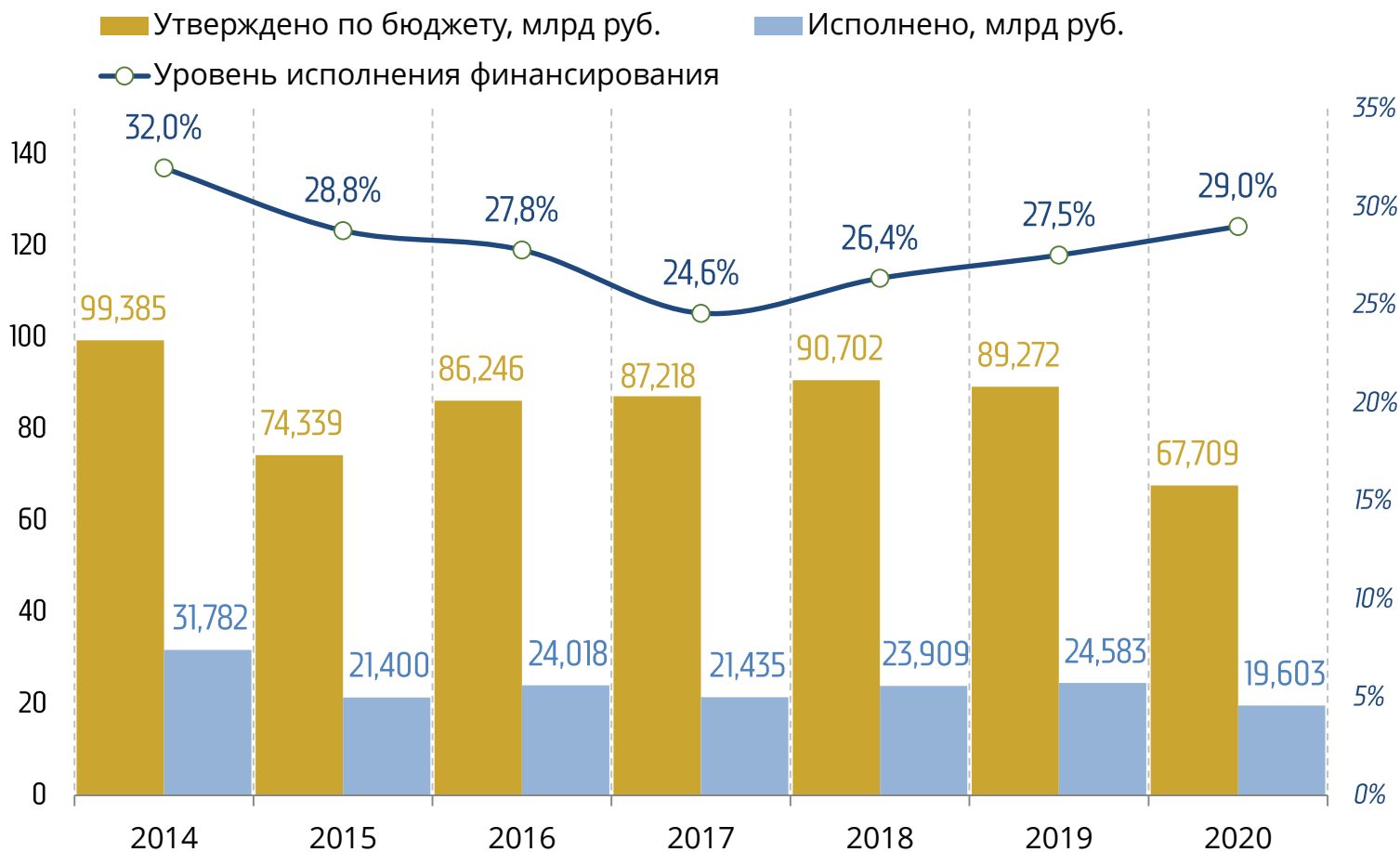
Динамика исполнения АИП за первое полугодие в 2014-2020 годах

Первоначально утвержденный объем АИП (100,9 млрд руб.) при весенней корректировке бюджета в 2020 году снизился на 32,9%. При перераспределении средств было максимально сохранено финансирование объектов, вводимых в текущем году, а также в плановом периоде 21-22 годов. Также обеспечено начало строительства наиболее значимых объектов инженерно-транспортной инфраструктуры и социальных объектов. Улучшение качества планирования расходов развития городского хозяйства положительно отразилось на уровне исполнения АИП за первое полугодие.