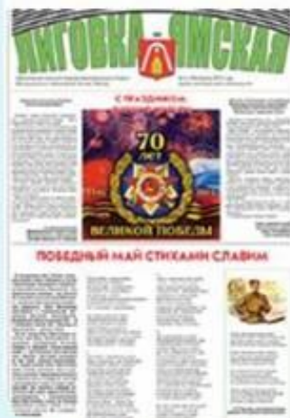
Выпуск №4 (189) апрель 2015