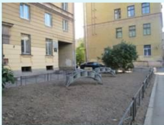
Гончарная ул. д. 21 после выполнения работ