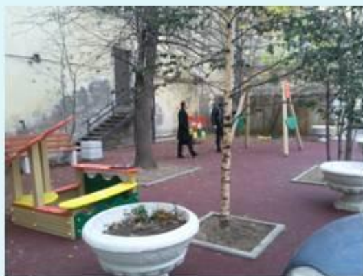
Гончарная ул. д. 18 после выполнения работ