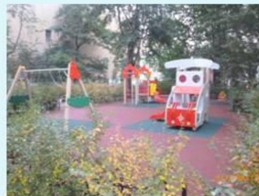
Гончарная ул. д. 17 после выполнения работ