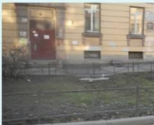
Гончарная ул. д. 21 до выполнения работ