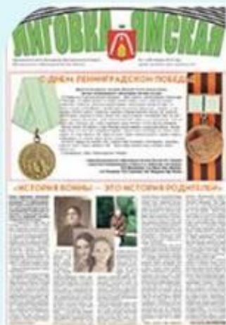
Выпуск №1 (186) январь 2015