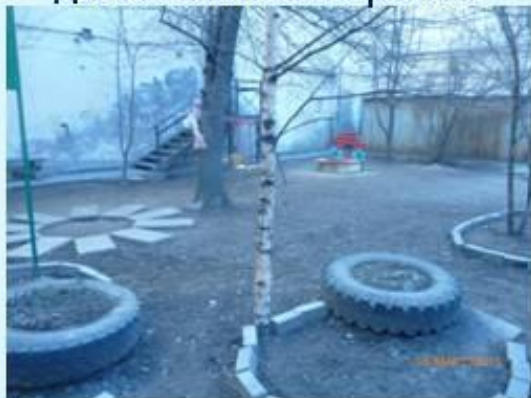
Гончарная ул. д. 18 до выполнения работ