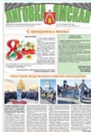
Выпуск №2 (187) февраль 2015