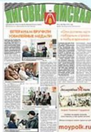
Выпуск №3 (188) март 2015