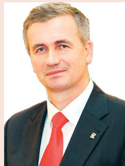
Глава Муниципального образования Лиговка-Ямская Вадим Войтановский

Пусть в каждом доме, в каждой семье царят мир, благополучие и радость! Желаю всем вам крепкого здоровья и преуспевания! С праздником!